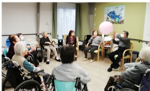
いつも熱戦の風船バレー