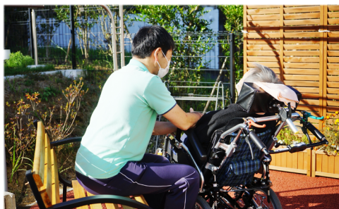
屋外レクスペースでひなたぼっこ