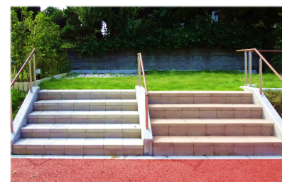
段高さの異なる階段で 昇降トレーニング