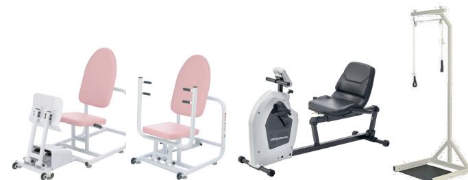
トレーニングマシン