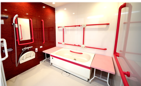
手すりや浴槽位置を動かせる機能的な浴室