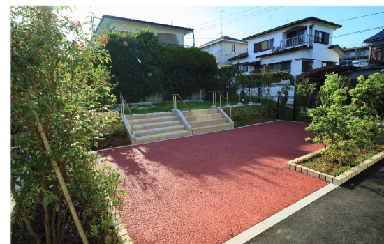
屋外レクリエーション兼トレーニングスペース