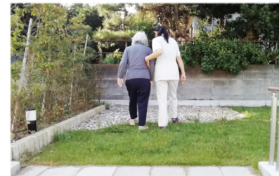
階段上の砂利エリアで 歩行トレーニング