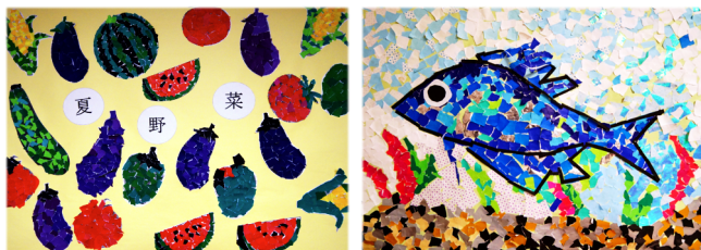
レクリエーションでのご利用者様の制作